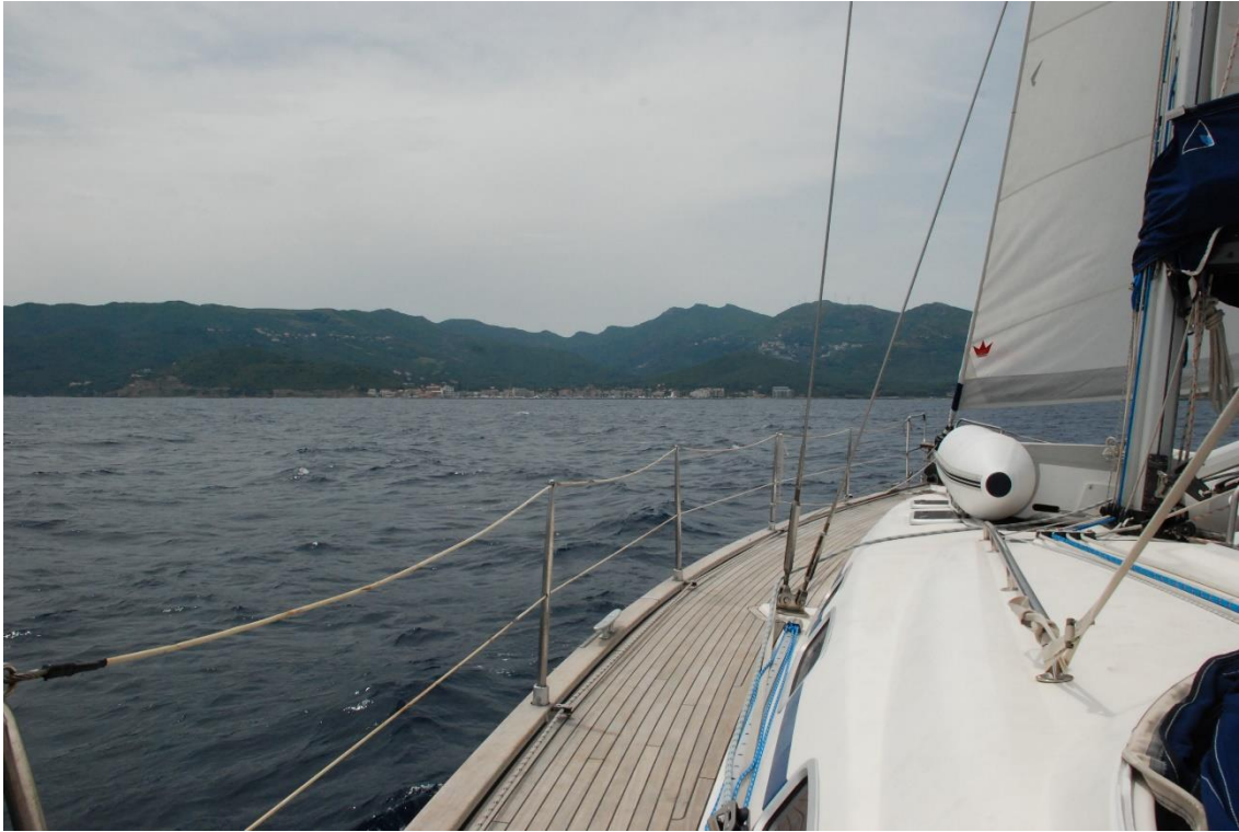
Kurz vor dem Hafen