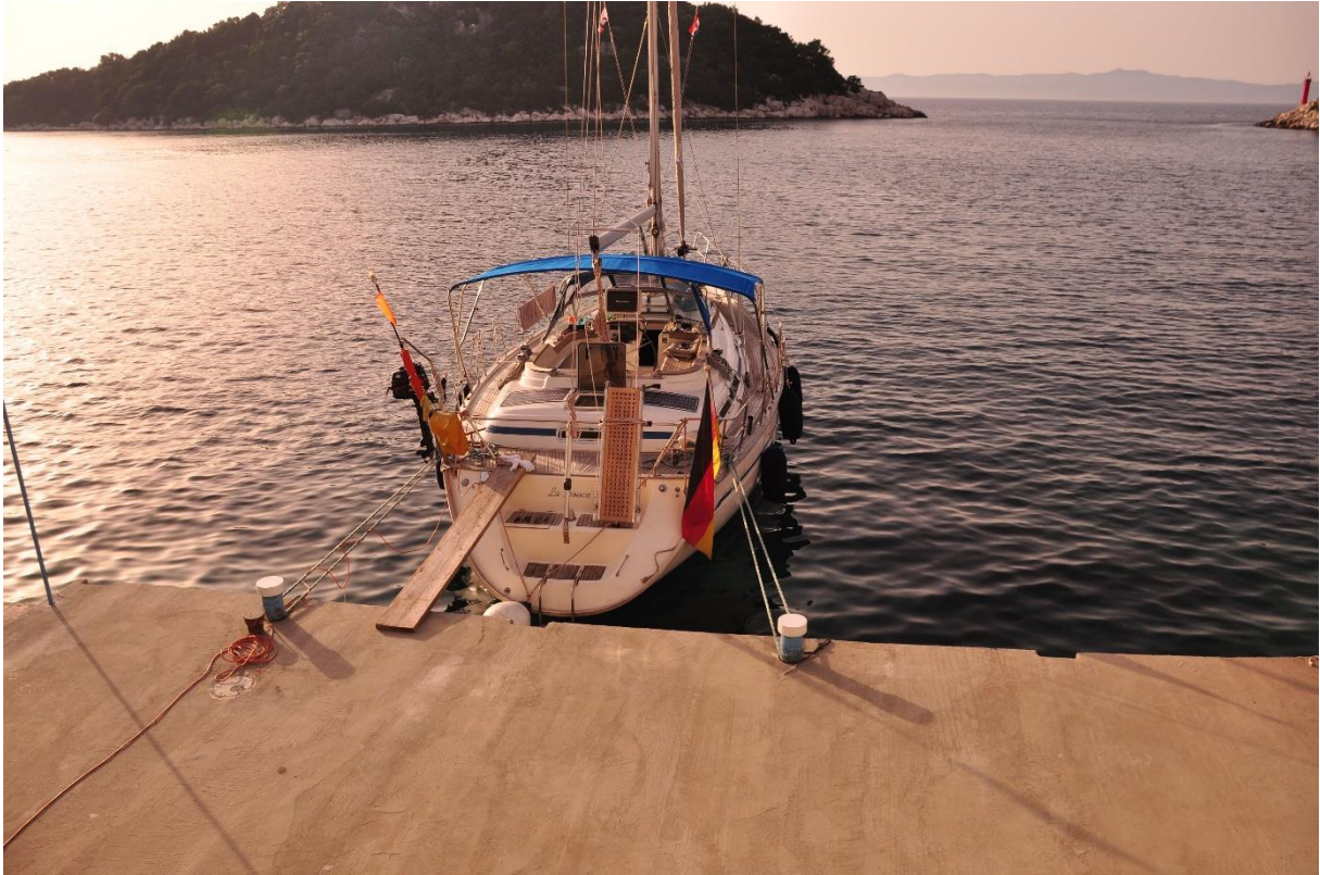
Der Blick beim Abendessen