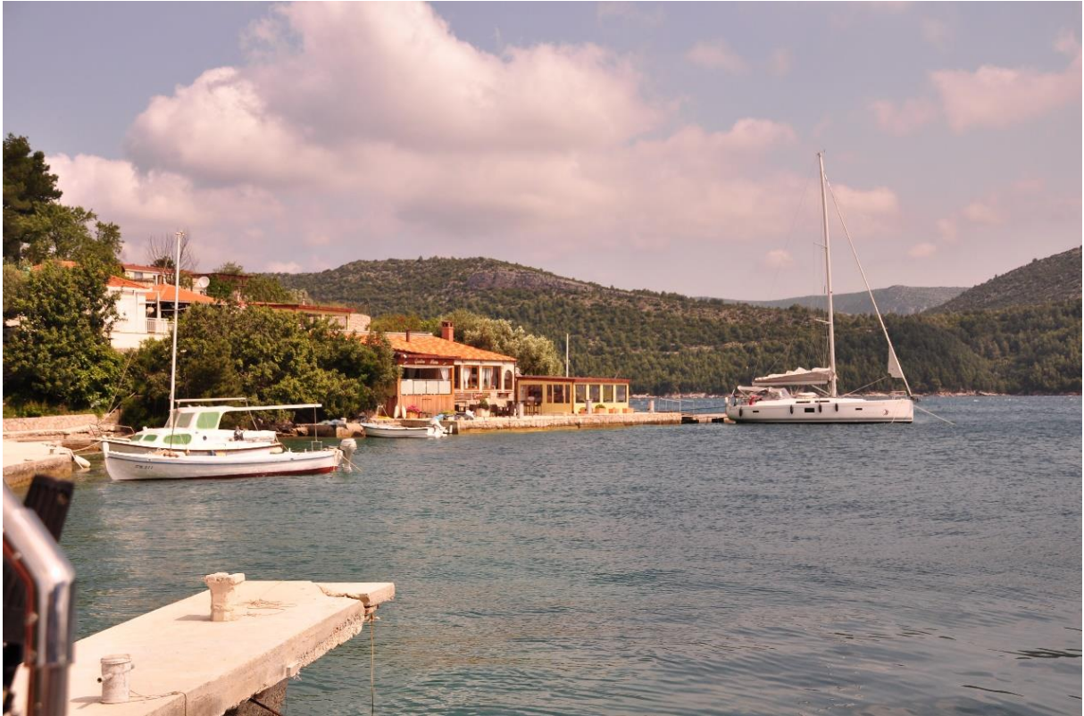
Beim Abendessen in der Taverne