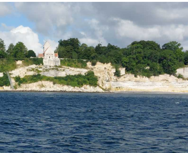
die Kirche 30 m über dem Meer