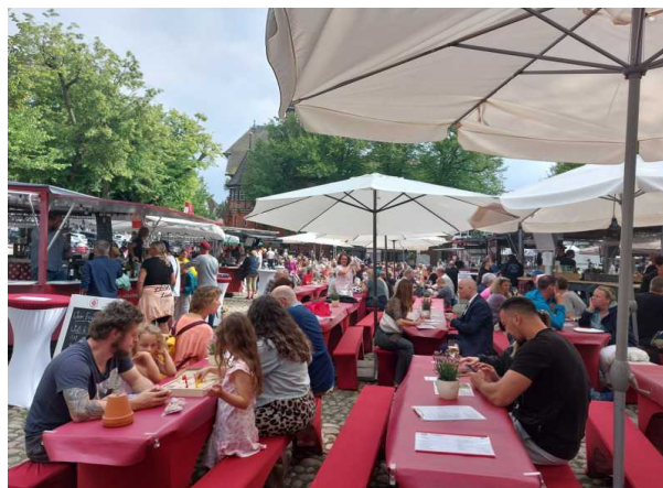
Weinfest auf dem Marktplatz

Auch das muntere Treiben des Weinfestes in Burg konnte uns nicht aufhalten.