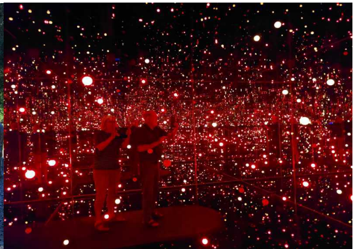
die Lichtinstallation von Kusama und wir :-)