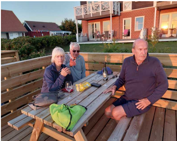
Die Grillplätze in Klintholm

Bei passendem Wind aus NO der Windstärke 4 und Böen bis 6 Bft machten wir uns auf nach Gedser.