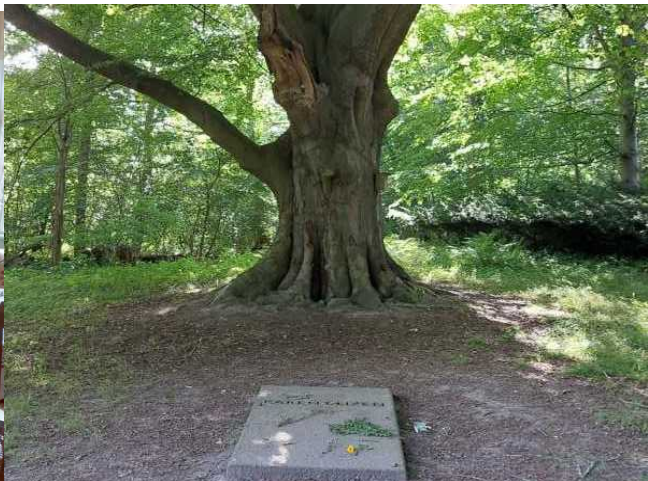
Ihr Grab unter der Buche

Kopenhagen war das nächste Ziel der Segelreise. Fest machen wir gerne in Lynetten-Margrethenholms Hafen.