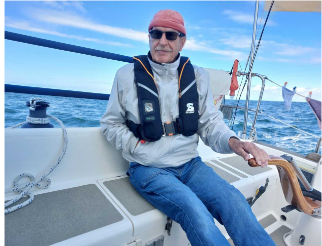
entspannt segelnder Skipper