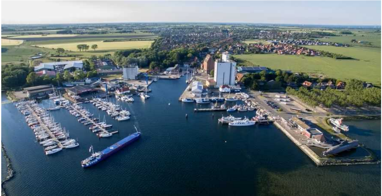
Burgstaaken, unser Heimathafen mit dem Binnenschiff davor welches zum Getreidekai fährt