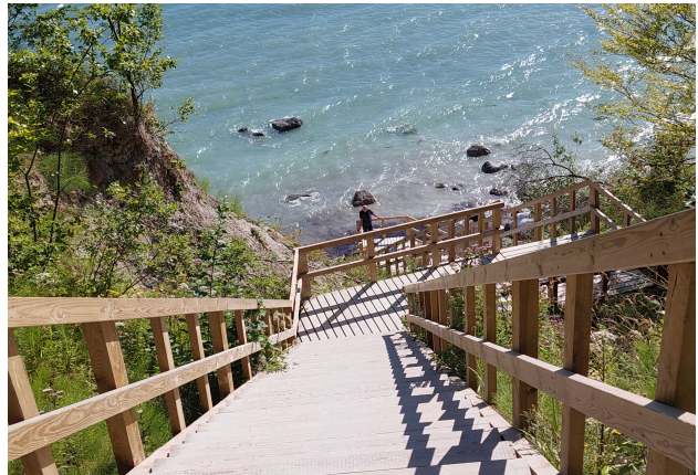
das Ende der Treppe und ich

Wir kannten schon die längste Treppe von Dänemark. Am nächsten Tag fuhren wir mit dem kostenlosen Bus zu den Kreidefelsen. Bezwangen mit unseren Freunden die längste Treppe, machten tolle Bilder vom Abstieg und den Kreidefelsen und besuchten auch das GeoCenter-Möns Clint das die geologischen Wunder der Erde und die Geschichte der Kreidefelsen erzählt.