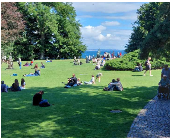
Der Park von Louisiana