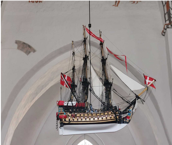
Dänisches Linienschiff Victoria von 1710