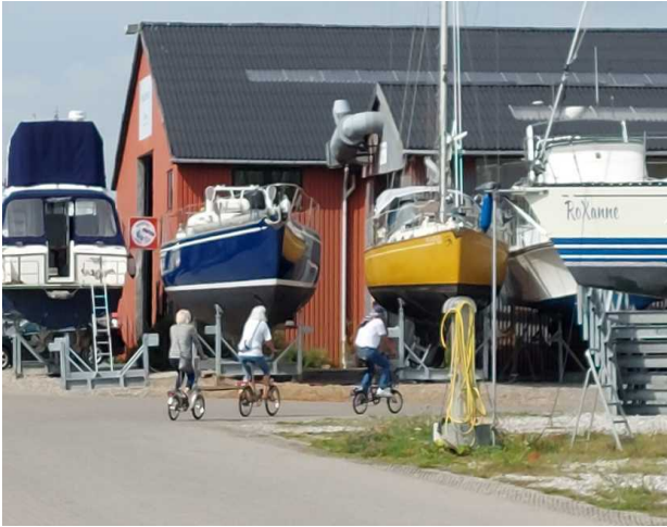
Kopenhagen ohne mich

Zug nach Köge gefahren. Es hat sich wirklich gelohnt. Mit einem Info-Blatt vom Touristenzentrum haben wir die schönsten Fachwerkhäuser aufgesucht und ich habe die interessante Geschichten zu den Häusern vorgelesen.