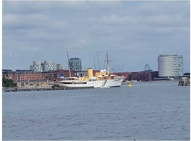
die Yacht der Königsfamilie

Die Eisenbahn in DK ist sehr preiswert besonders für Rentner. Für die 35 Min Fahrt hat jeder 30 DK = 4,00 € bezahlt.