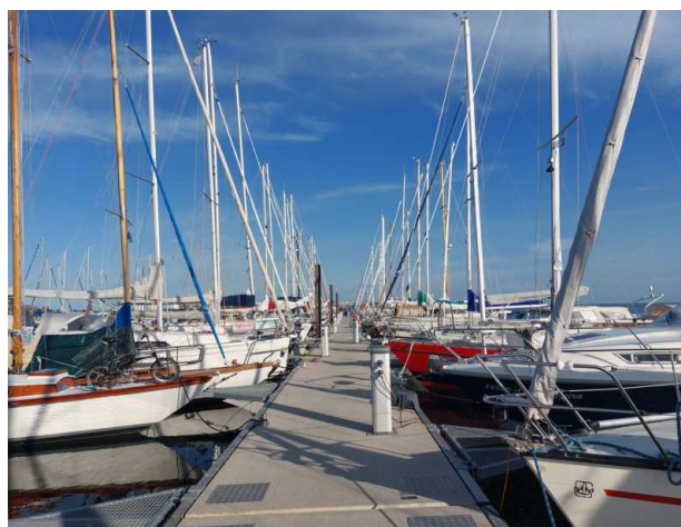
voller Hafen in Grömitz

Mit kräftigen 4 bis 5 Bft. und zwei Reff's im Groß geht es zurück nach Burgstaaken.