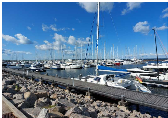
Kühlungsborn mit der XENIA

Später konnten wir noch die zwei Reffs aus dem Groß entfernen, erreichten die rote Tonne südlich von Falster, änderten wir den Kurs auf West und waren 16:40 Uhr im Hafen von Gedser. 38,1 SM zeigte unsere Logge.