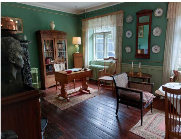
Das Schreibzimmer der Schriftstellerin

Das Buch Jenseits von Afrika und der Film hat die Schriftstellerin weltberühmt gemacht. Ihr Wohnsitz ist so erhalten wie sie ihn nach ihrem Tod im September 1962 verlassen hat. Selbst ihre Lieblings-Blumensträuße werden immer wieder aufgestellt.