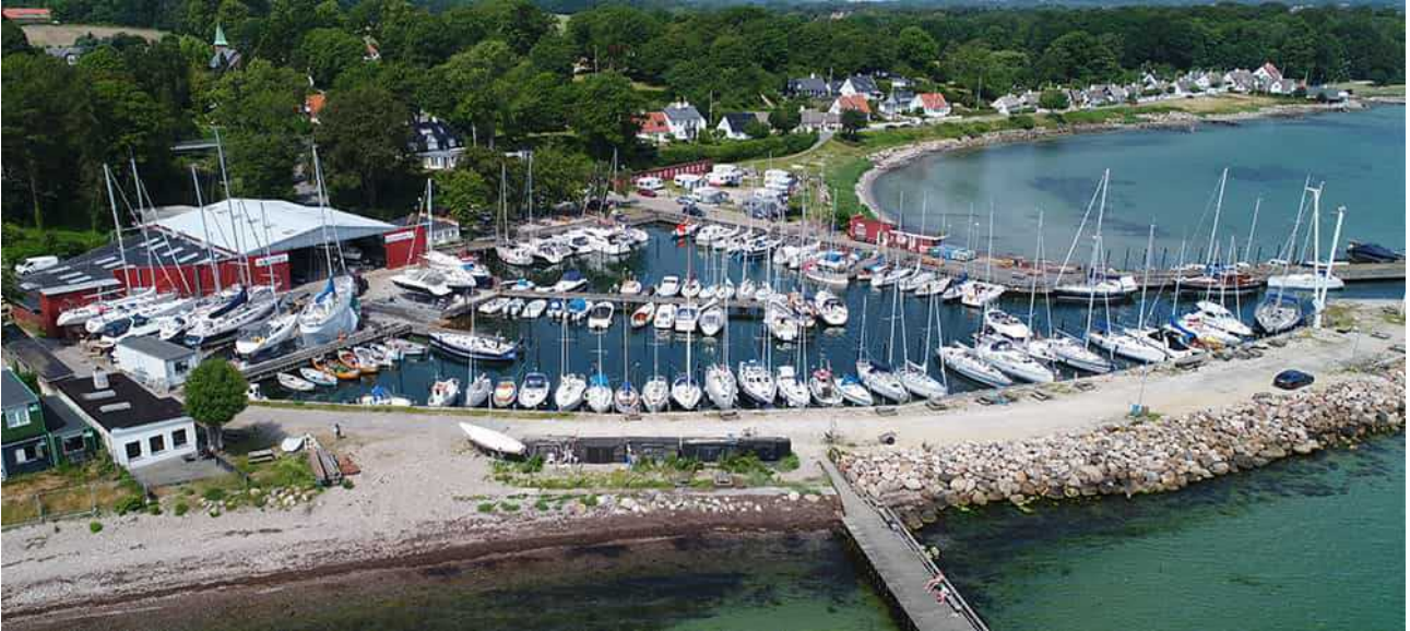
Der kleine, enge und gemütliche Hafen vom Humlebæk

An Kopenhagen vorbei ging es dann weiter bis nach Humlebäk.