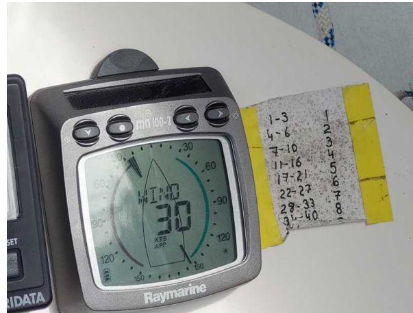
unser Windmesser bei Bft 7

Nachmittags sind wir zu den wunderschön gelegenen Rasmussen – Haus gewandert. In dem Haus ist heute ein Museum welches das Leben und Abenteuer des bekannten Grönlandforschers erzählt.