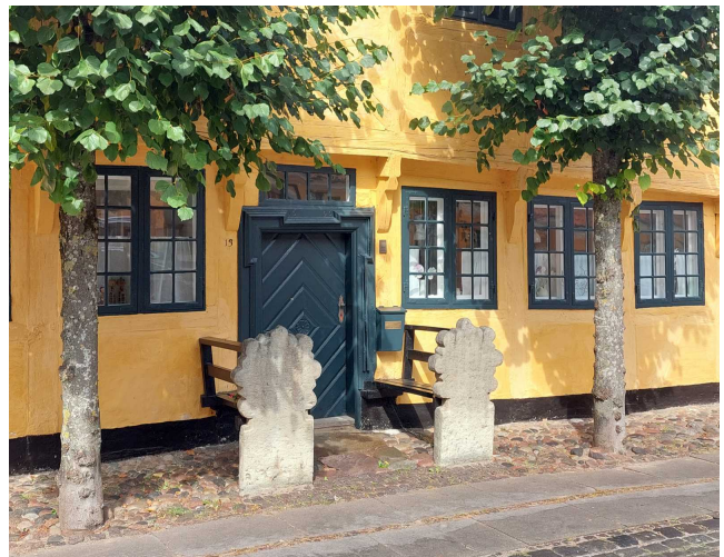
Haus in Köge mit Türbänken

Den weiteren Hafentag nutzen wir erneut um mit dem kostenlosen Museumsbus 1 Std. 10 Min. zu dem kleinen Hafen Börjeskol zu fahren und auf dem Rückweg beim Klint