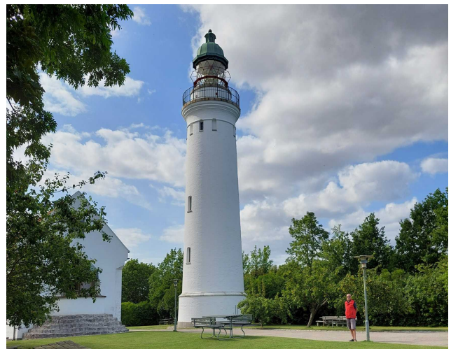
Leuchtturm von Stevens