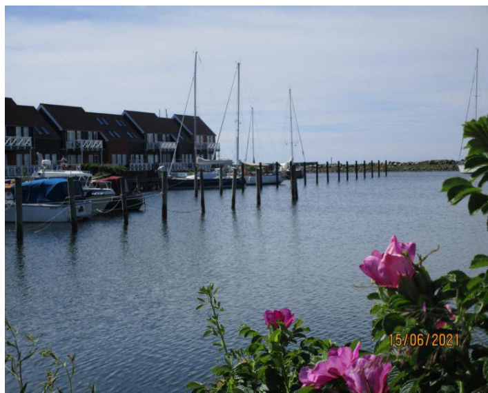
Im leeren ruhigen Hafen Gedser