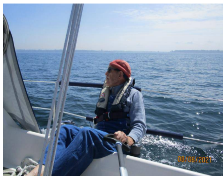
Skipper auf dem Lieblingsplatz