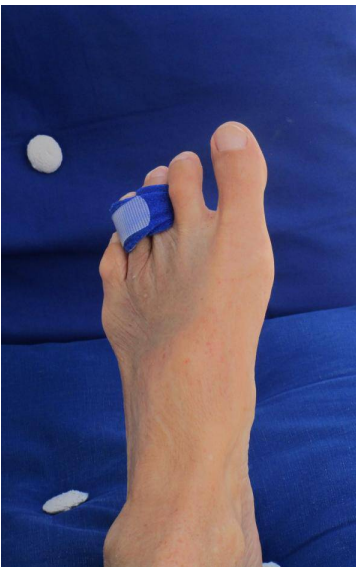
Der schmerzende Zeh

Ein sehr, sehr nette Mitarbeiter des Unternehmens bot sich an uns ins Zentralkrankenhaus der Region, die 23 km nach Nykoebing zu fahren. Er rief für uns dort an. An der Notaufnahme wurde uns gesagt, das es an diesen Mittwoch ungewöhnlich voll sei. Warten war angesagt. Der Fuß wurde geröntgt und man sah das der Kochen längs gespalten war. Mit einen Spezialverband wurde der gebrochene Zeh am nächsten fixiert und wir wieder entlassen. Mit einen Taxi waren wir dann morgens um 03:00 Uhr wieder an Bord.