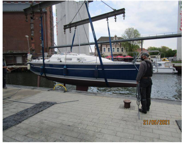
Der erste Kontakt

Am 09. Juni ging es endlich nach Norden Richtung Gedser. Leider kam der versprochene "Dreier aus West" nicht und wir mussten viel motoren. Große Aufregung ist immer an Bord wenn wir Schweinswale hören oder zu Gesicht bekommen. Mit Spannung versuchen wir zu beobachten wo diese Tiere erneut auftauchen. Viele Rücken haben wir gesehen.