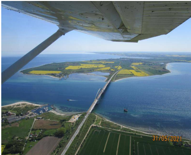
Blick aus der Cessna auf die Sundbrücke

Auch noch viele andere Teile mussten ersetzt oder repariert werden. So verging Tag für