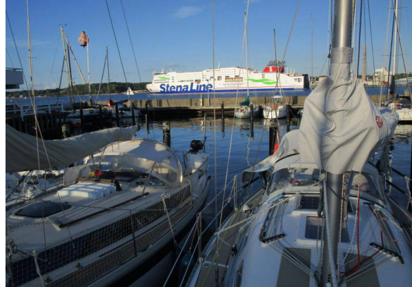
Blick von der Xenia auf die Förde

11.08. Wir verlegen uns nach Kiel. Fest machen wir im ehemaligen Olympiahafen. Auf der breiten Uferpromenade kommt man bequem zu Fuß und per Fahrrad in die Stadt. Wir haben am ersten Schlenkel festgemacht. Morgens und abends fahren die großen Fähren und Kreuzfahrtschiffe rein und raus und sind zum Greifen nah.