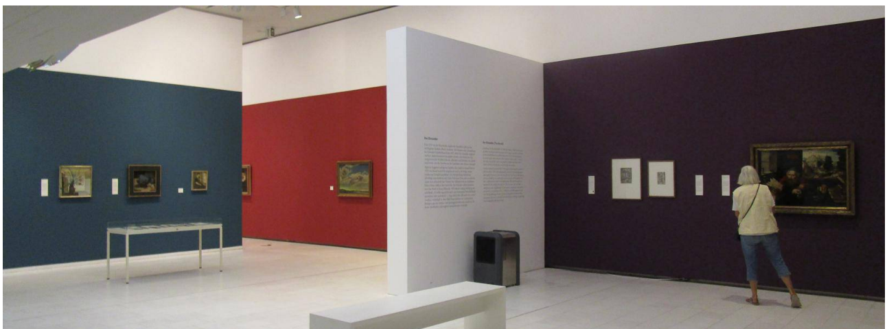
Kunsthalle in Kiel