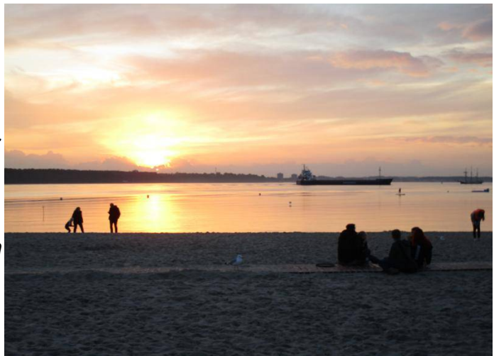
Abendspaziergang am Strand von Laboe

Wir schreiben Samstag, den 08.08. und es soll nach Laboe gehen. Es wird ein wunderschöner Törn aus der Eckerförender Bucht über 18,5 sm. Schon allein die Kieler Förde zu queren ist spannend, selten hatten wir so viel Schiffsverkehr. Neben vielen Segelyachten, Motorbooten ist reger Verkehr der Großschiffahrt zum und aus dem Nord-Ostsee-Kanal unterwegs und das alles bei schönstem Wetter.