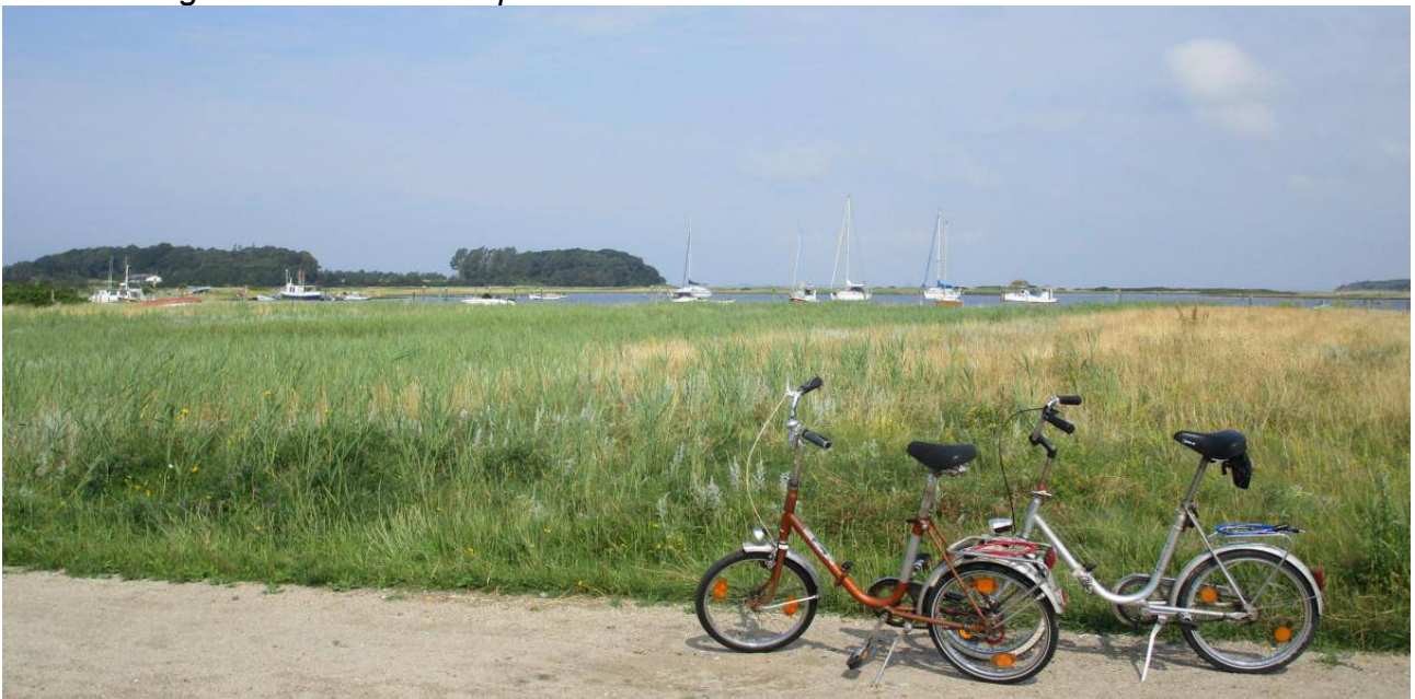
Schöne Ankerbucht hinter der Halbinsel Thorö

Es wurde ein langer, netter Abend. Es fing noch an heftig zu regnen und ein schweres Gewitter zog über die Stadt. Empfohlen wurde unter anderem ein Besuch der