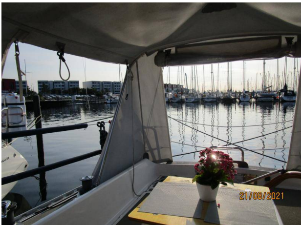
Sonntag in Burgtiefe

Dann kaufen wir noch neue Filter und Motoröl. Am nächsten Tag werden weiter Faltkisten und Taschen gefüllt und im Skoda verstaut. Für den nächsten Tag habe ich nur Regenschauer und viel Wind notiert. Mit einem Segelfreund und seiner HR 29 tuckern wir von Burgtiefe nach Burgstaaken unter den Kran